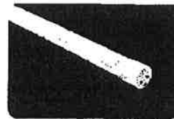
40W型 蛍光管タイプ 発光色は3種類